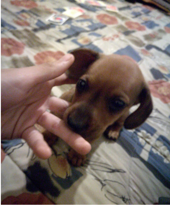
Comienzos de la cuarentena